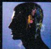
Le dernier album "Corps & Armes"