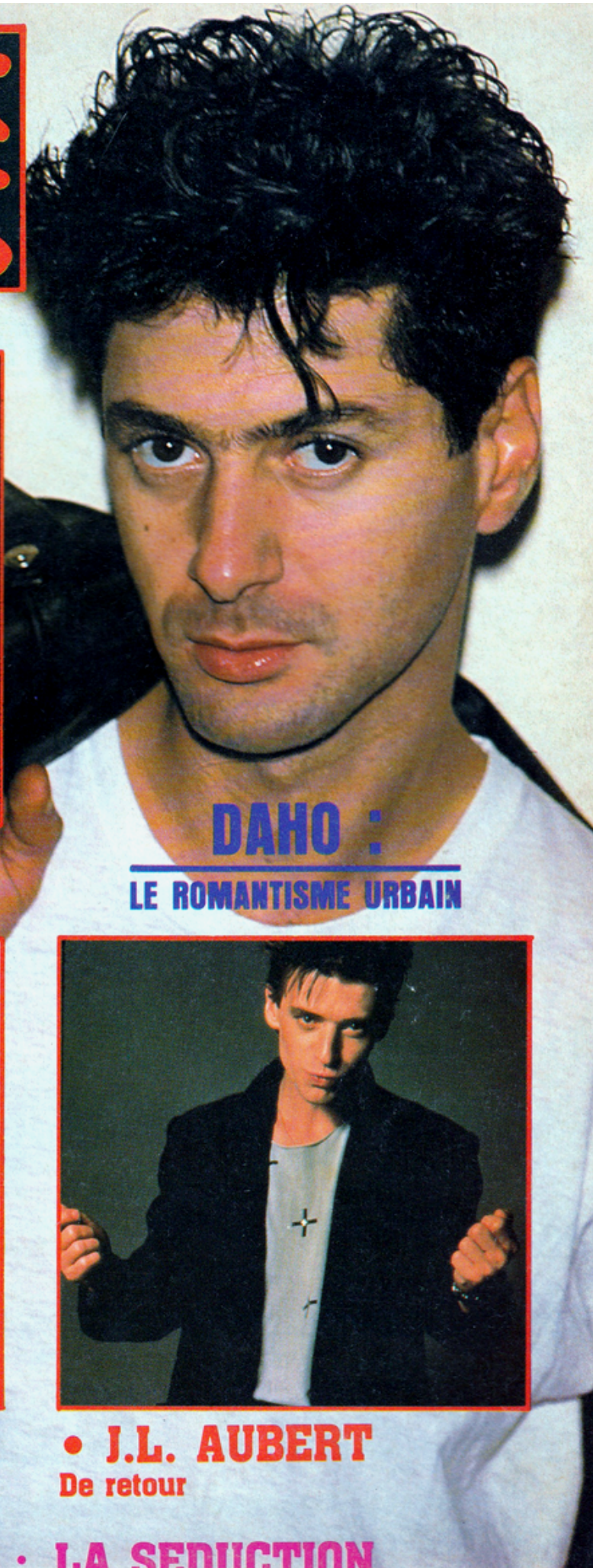
DAHO : LE ROMANTISME URBAIN