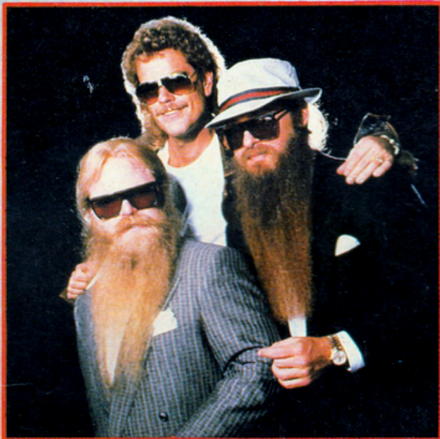
• ZZ TOP : la riposte des sudistes