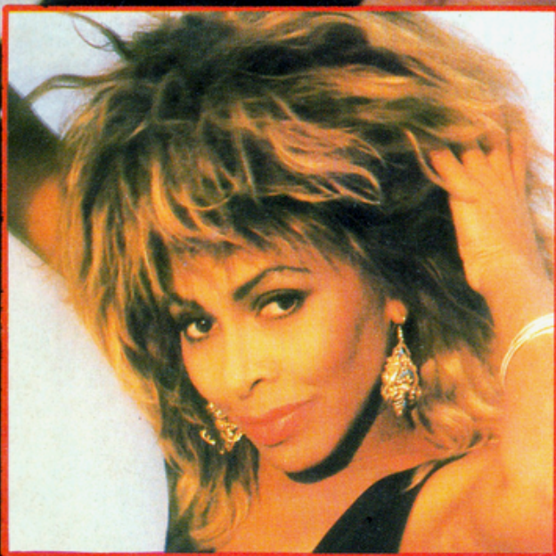
• TINA TURNER : Sex, soul & fun