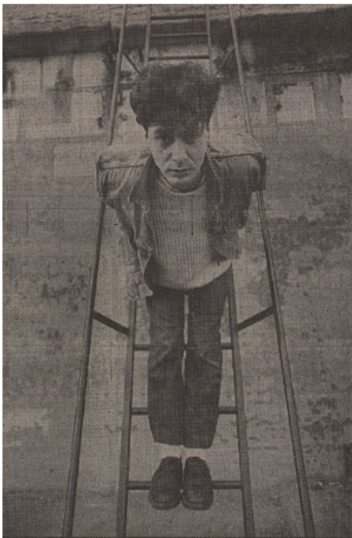
□ ÉTIENNE DAHO Une rentrée sur scène attendue.