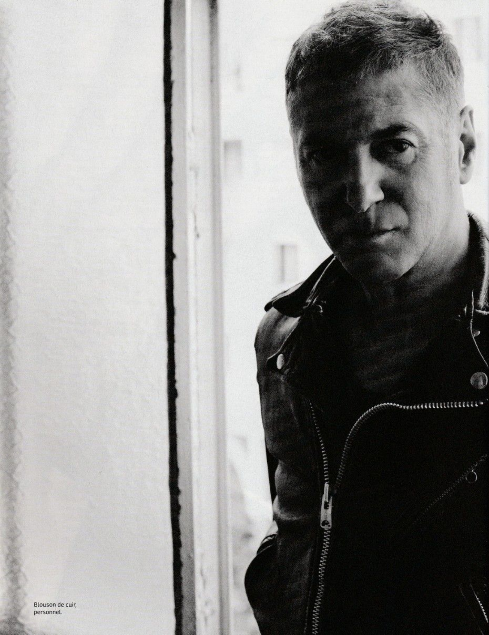
Blouson de cuir, personnel.