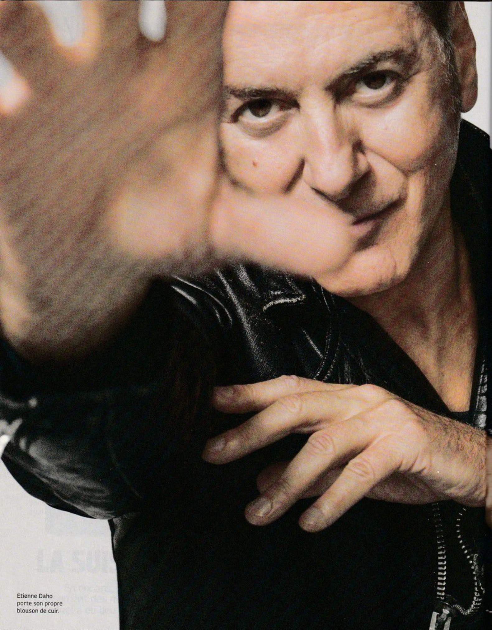
Etienne Daho porte son propre blouson de cuir.