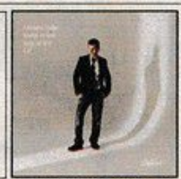
ETIENNE DAHO: "Sortir ce soir Best Of Live" CD ou DVD, EMI

E.D. - Murat, je m'en fous. Je crois qu'il se fait plus de mal à lui-même qu'à moi. Quand on parle de lui dans les médias, c'est pour les propos qu'il tient à mon égard. On ne fait même plus référence à ses disques. Je crois qu'il doit être très jaloux.