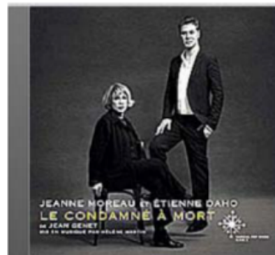
Le Condamné à mort, de Jean Genet Jeanne Moreau et Étienne Daho

Ce disque n'a rien d'une incongruité. Voilà sans doute pourquoi il est réussi. Car autant le dire, nonobstant son prestigieux casting, le pari était sérieusement casse-gueule. Pour Daho, surtout : on ne chante pas inopinément un texte aussi cru lorsque l'on a (à tort ou à raison) une image pop, légère et dansante, un brin évanescence. Or, loin d'être gêné par le langage quasi organique du texte, ses considérations physiques bien plus que sentimentales, le chanteur y paraît au contraire totalement à son aise, comme libéré d'une pudeur qui jusqu'à présent le retenait. Sa voix n'est plus sous-mixée comme par le passé, elle est très avant ; et les mots ne se fondent plus dans les nappes de synthé, ils se détachent avec une précision d'orfèvre. En somme, jamais Daho n'a aussi bien chanté. Il fallait l'audace de Genet pour nous le révéler ; libre ensuite à chacun d'être touché ou pas - le propos érotico-gay sera de toute façon trop segmentant pour plaire à tout le monde. Quant à Jeanne Moreau, la récitante, elle se montre particulièrement convaincante dans la dédicace qui remet le texte dans sa perspective historique. Et qui fait de l'objet plus qu'un disque, un document.